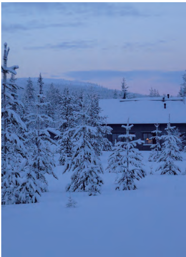
Äkäslompolo - Ylläs - location de chalets 8 jours/7 nuits - vols inclus dès CHF 1'159.- (jan. 2019)