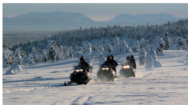
Ruka - Semaine active avec excursions 8 jours/7 nuits - vols inclus dès CHF 1'440.- (fév. 2019)